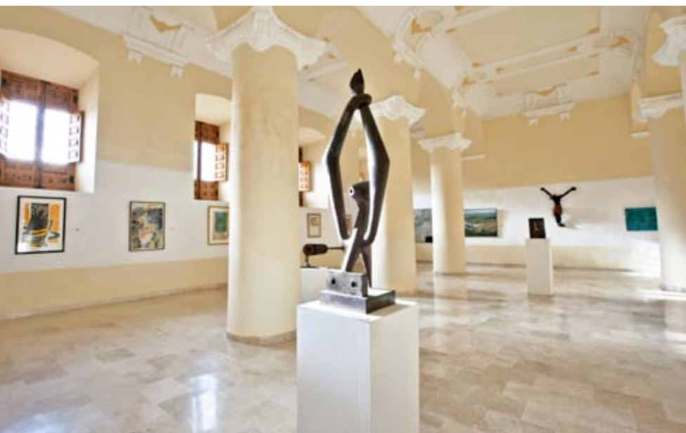
Museos, Monasterio de Nuestra Señora de la Merced, Huelva