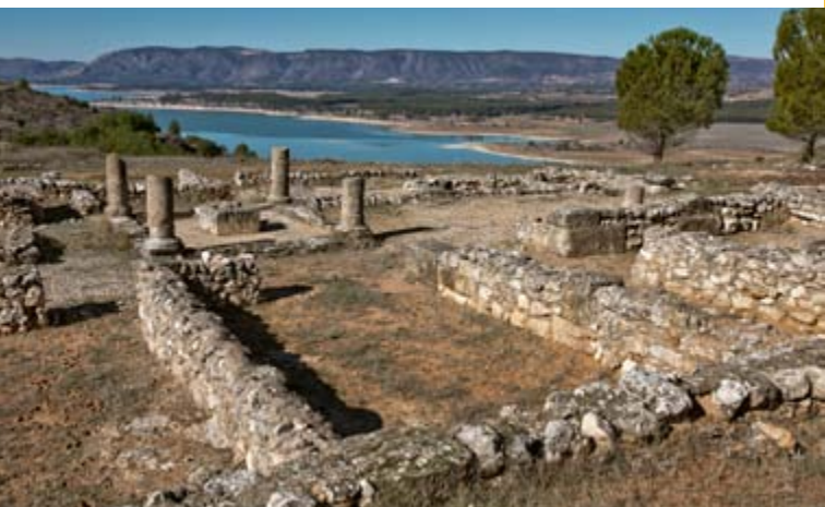
Casa del médico, ciudad romana de Ercávica

Al sur del Foro se encuentra un conjunto de viviendas que conservan pinturas murales y entre las que destaca la Casa del Médico, así denominada porque durante su excavación se encontró utilaje sanitario. Se organiza en torno al atrio con un implivum (estanque rectangular) sustentado por cuatro columnas.