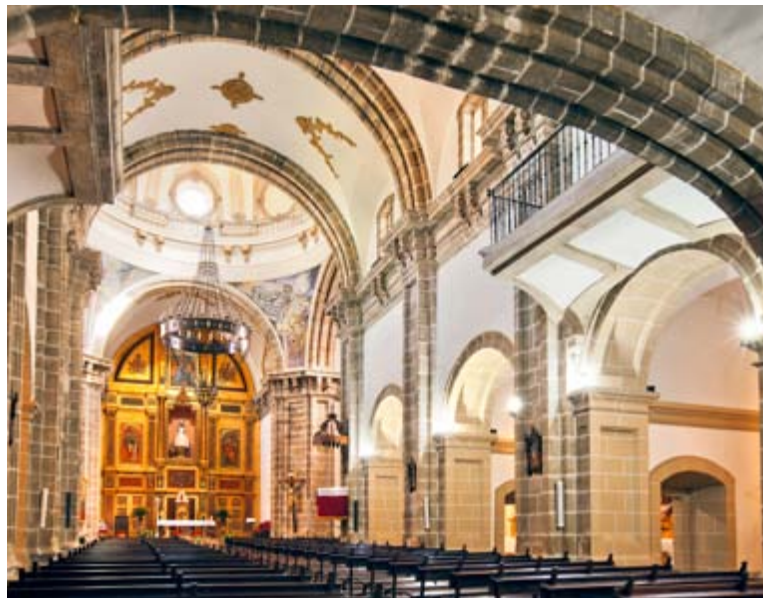
Iglesia, Monasterio de Nuestra Señora de la Merced, Huelva

Mención especial merece el Museo de Arte Contemporáneo 'Florencio de la Fuente' que en la hermosa estancia de la antigua sala capitular contiene obras de Picasso, Dalí, Guayasamín, Rueda y Matheu. En las inmediaciones de la Merced está el Museo de la Fragua, dedicado al arte de los herreros.