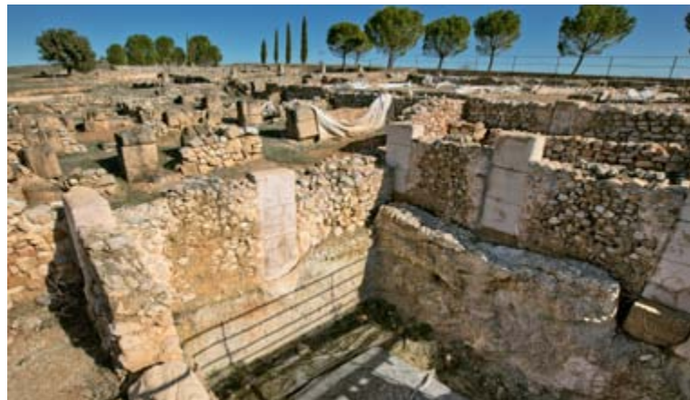
Domus, ciudad romana de Ercávica

cola del embalse de Buendía. Como tantas veces sucede en territorio conqense la historia y la naturaleza se hacen una para deleite de los sentidos del viajero.