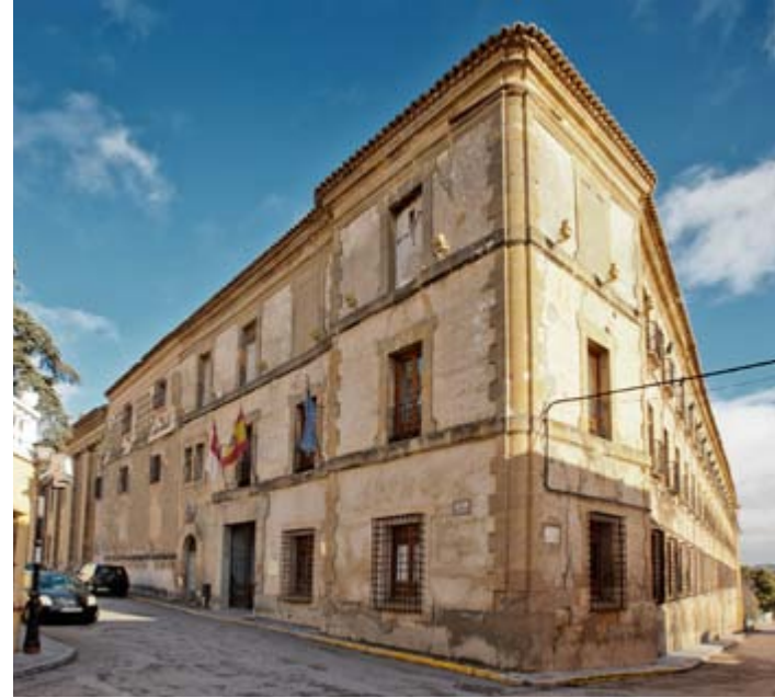
Monasterio de Nuestra Señora de La Merced, Huete

Hay localidades donde la historia y el arte no son una excepción consreñida a algún edificio refugiado en una isla monumental sino que constituyen su esencia y acaban por impregnar cada detalle de su paisaje urbano. Es el caso de Huete , en plena Alcarria, que conserva las muestras de su condición de influyente ciudad sobre un vasto territorio. Cada civilización ha dejado su legado hasta configurar un conjunto único repleto de conventos, iglesias, palacios y ermitas. La piedra convertida en creatividad y solemne presencia.