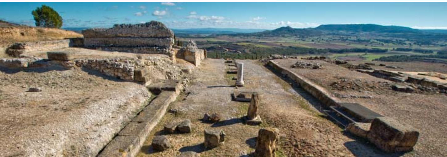
Foro, ciudad romana de Ercávica

La urbe fue reseñada en sus obras por Livio o Ptolomeo, después fue cabeza de un Obispado y conserva muchas zonas visitables. Aún hoy se puede respirar la grandeza de su Foro, un complejo monumental que constituía el centro de la ciudad y que se articula mediante un espléndido