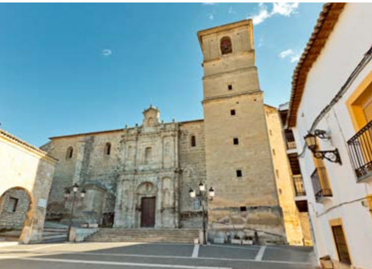
Iglesia parroquial de la Asunción y embalse de Buendía

Sus alrededores parecen inventados para el senderismo. Un itinerario sencillo y sorprendente es la Ruta de las Caras, que recorre un camino repleto de esculturas de grandes dimensiones labradas en la roca.