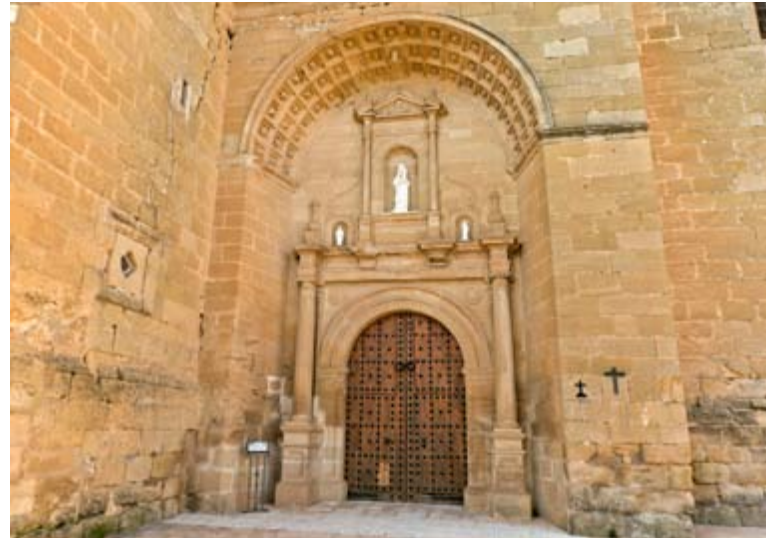
Pórtico de la Iglesia de Garcinarro

La Plaza Mayor de Buendía es un magnífico ejemplo del renacimiento en la provincia