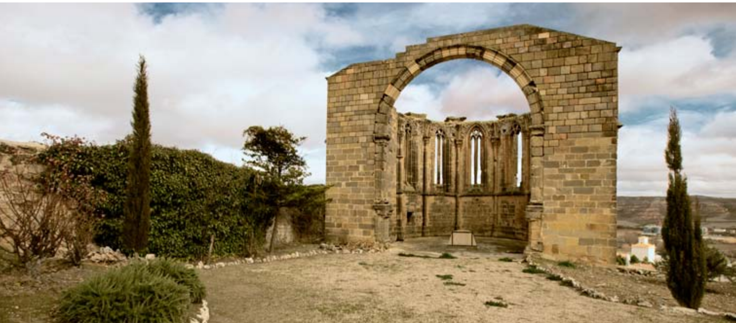
Iglesia de Santa María de Atienza, Huelva

El ábside de Santa María de Atienza data del siglo XIII y es una singular muestra arquitectónica del estilo gótico